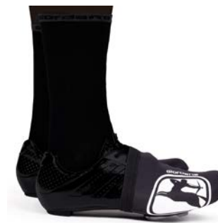
NEOPREN Toester GICW21-TOES-NEOP-BLCK schwarz / M-XXL / CHF 59.00