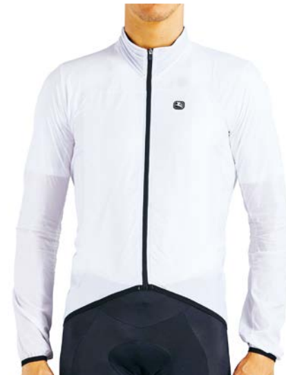
Zephyr Windjacke GICS19-JCKT-ZEPH-WHIT weiss / XS-3XL / CHF 179.00