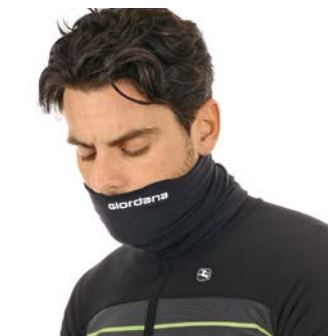
Halsschutz GICW19-NECK-GAIT schwarz / oneseize / CHF 39.00