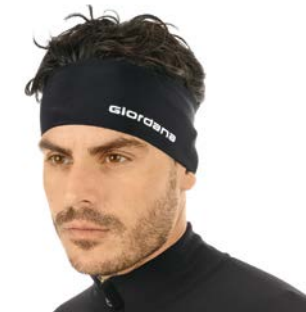
Stirnband GICW18-EARCOVER schwarz / oneseize / CHF 29.00