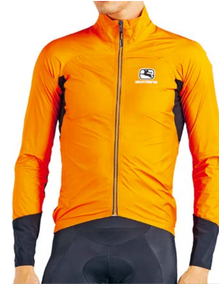
Monsoon Lyte Regenjacke GICS18-JCKT-MOLY-ORANGE orange / S-2XL / CHF 469.00