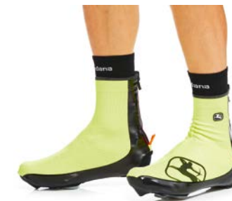
AV 100 Schuhüberzug GICW16-SHCO-A100-FLYL neongelb / S-XXL / CHF 119.00