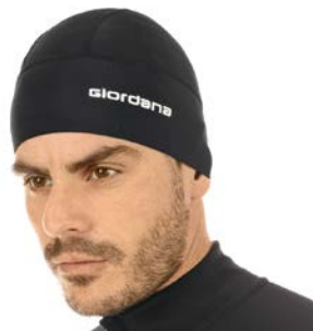
Cap GICW18-SKULLCAP schwarz / oneseize / CHF 29.00