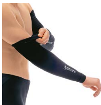
Armstulpen Dryarn seamless GI-W1-ARMW-BCLW-BLCK schwarz / XS/S / M/L / CHF 59.00