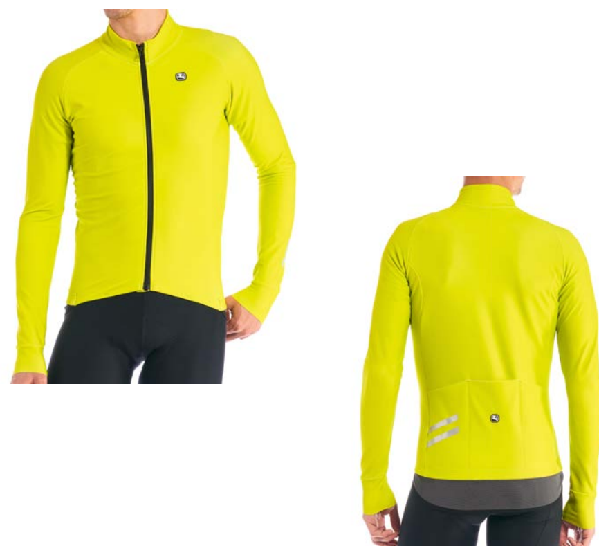
AV G-Shield Langarmtricot GICW21-LSJY-GSHI-AGRN acid-grün / S-XXL / CHF 249.00