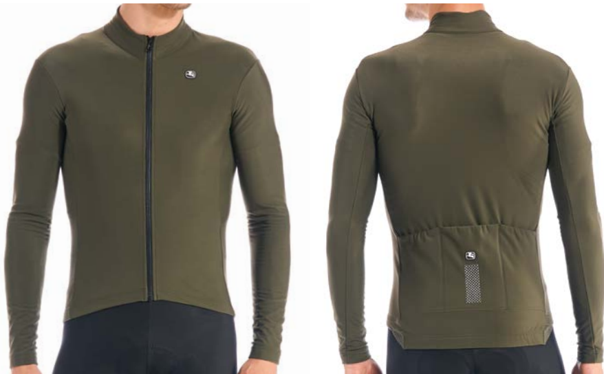
SILVERLINE Langarmtricot GICW21-LSJY-SILV-OLIV olive / M-4XL / CHF 159.00