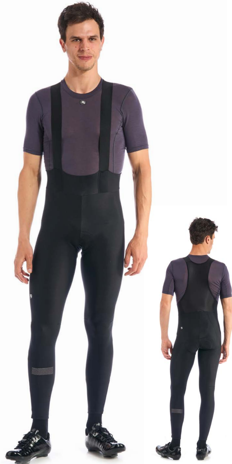
SILVERLINE Thermo Trägerhose GICW21-BITI-SILV-BLCK schwarz / S-4XL / CHF 199.00