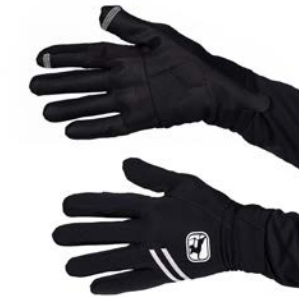
AV G-Shield Handschuhe GICW21-WNGL-GSHI-BLCK schwarz / S-XXL / CHF 99.00