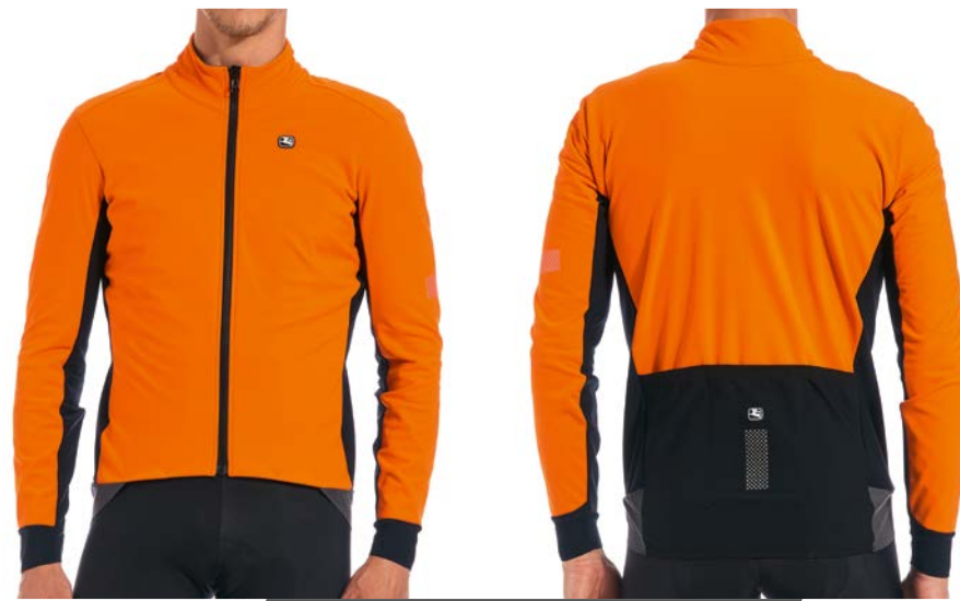
SILVERLINE Winterjacke GICW21-JCKT-SILV-ORAN bright-orange / M-4XL / CHF 299.00