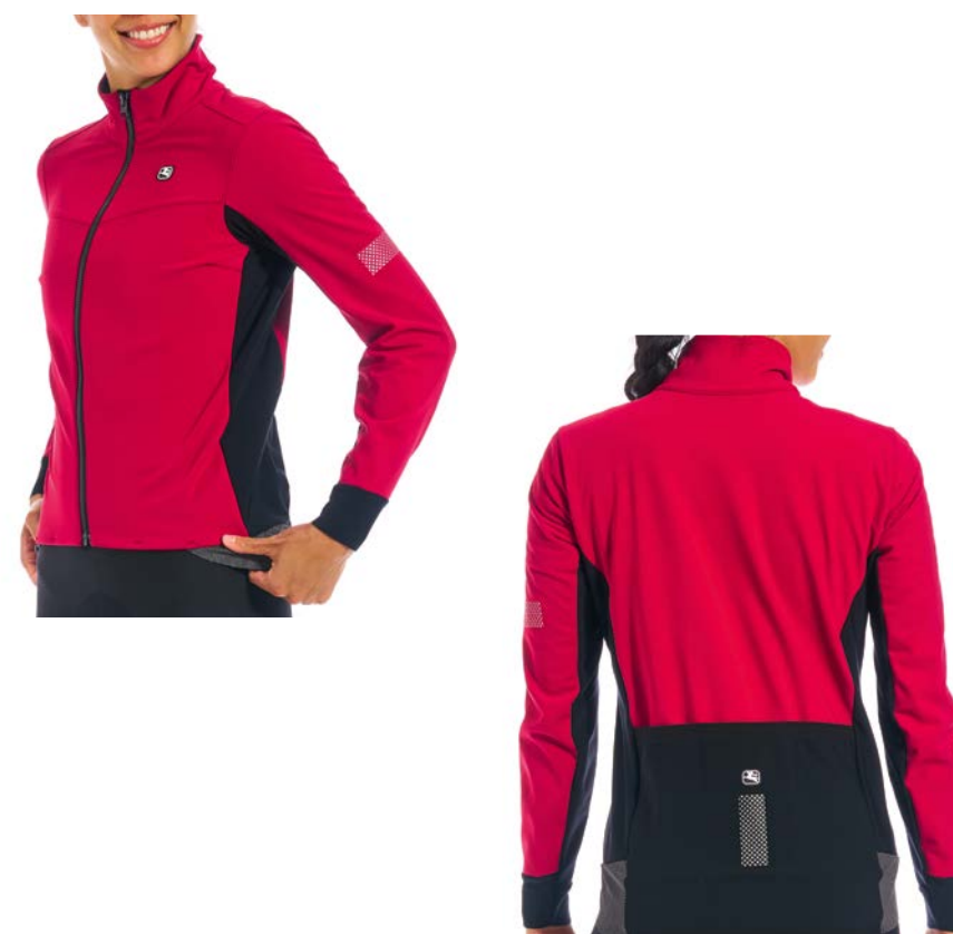
SILVERLINE Women Winterjackette GICW21-WJCK-SILV-SANG sangria / XS-XL / CHF 299.00