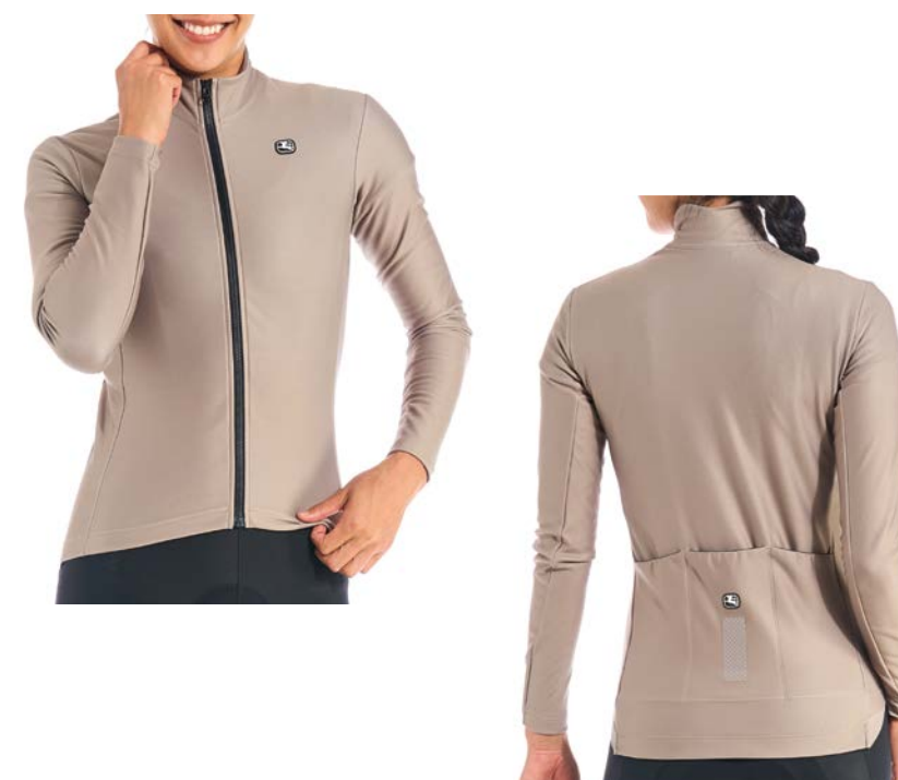
SILVERLINE Women Langarmtricot GICW21-WLSJ-SILV-GREY dove-grey / S-L / CHF 159.00