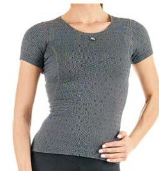
CERAMIC Kurzarm-Thermoshirt Women GICW16-WSSB-CERA-GREY grau / XS-XL / CHF 79.00