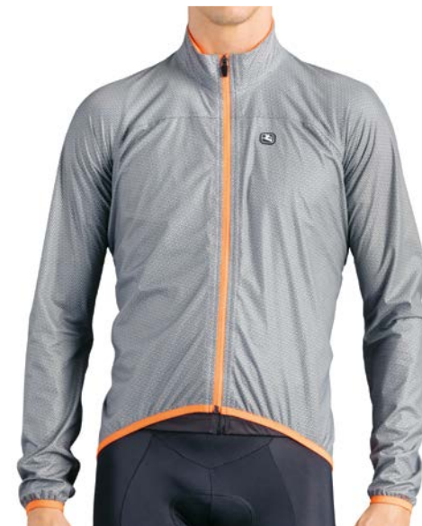
Monsoon Regenjacke GICW16-JCKT-MONS-GREY grau-orange / S-XL / CHF 549.00