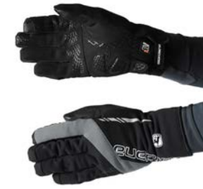
AV 300 Handschuhe GICW19-WNGL-A300-BKGY schwarz-grau / S-XXL / CHF 129.00