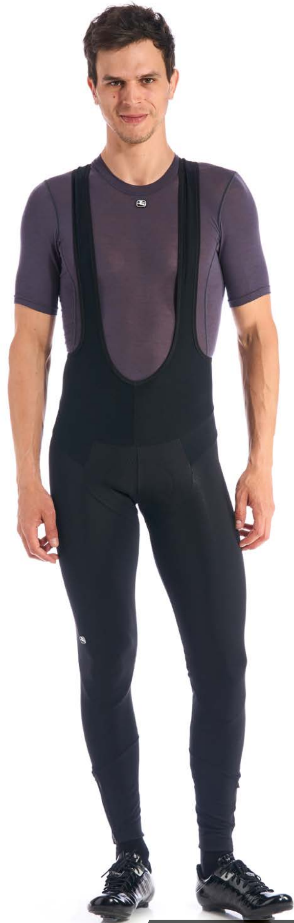
AV Thermo Trägerhose winddicht GICW21-INBT-WIND-BLCK schwarz / S-XL / CHF 379.00