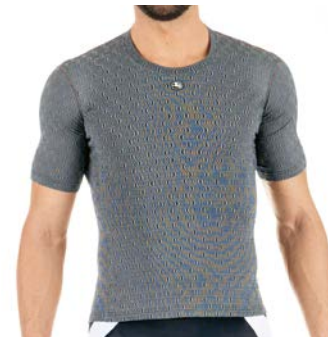
CERAMIC Kurzarm-Thermoshirt Men GICW16-SSBL-CERA-GREY grau / S-XXL / CHF 79.00