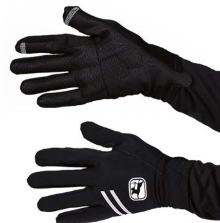
AV G-Shield Thermo-Handschuhe GICW21-WNGL-GSHI-BLCK schwarz / S-XXL / CHF 99.00