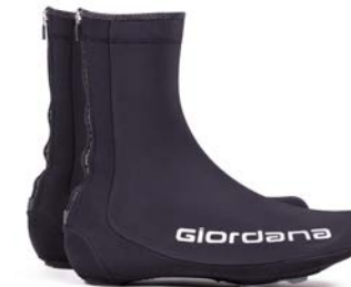
AV 200 Schuhüberzug GICW21-SHCO-A200-BLCK schwarz / M-XXL / CHF 149.00