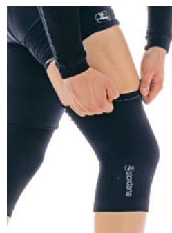
Kniestulpen Dryarn seamless GI-W1-KNEW-BCLW-BLCK schwarz / XS/S / M/L / CHF 49.00