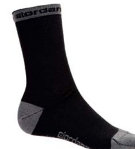
MERINO Wool Socken GICW19-SOCK-WOOL-BKGY schwarz-grey / S-L / CHF 35.00