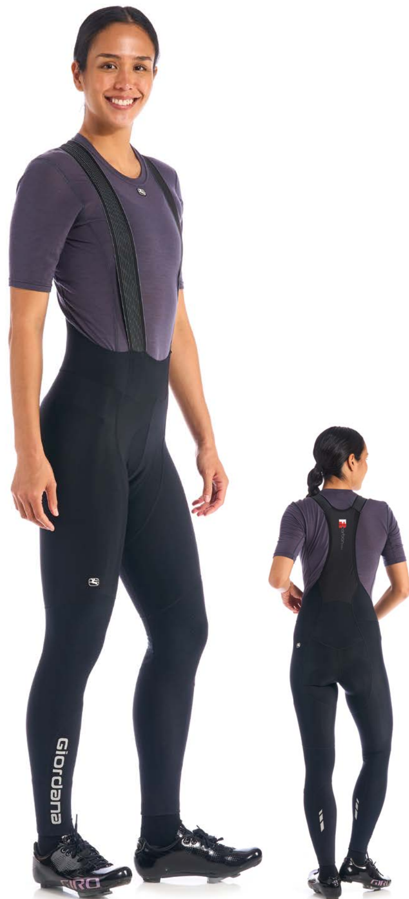
FRC PRO Thermo Trägerhose GICW21-WBIT-FRCP-BLCK schwarz / XS-XL / CHF 289.00