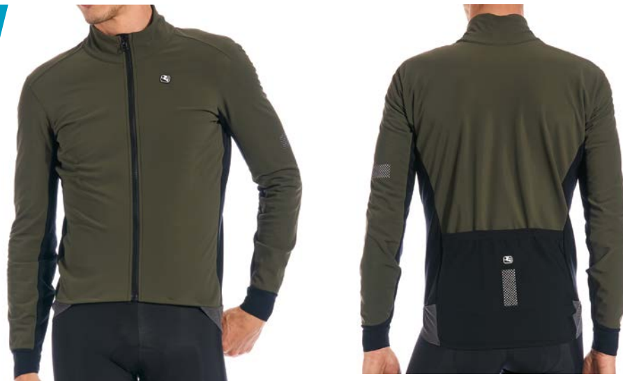
SILVERLINE Winterjacke GICW21-JCKT-SILV-OLIV olive / M-4XL / CHF 299.00