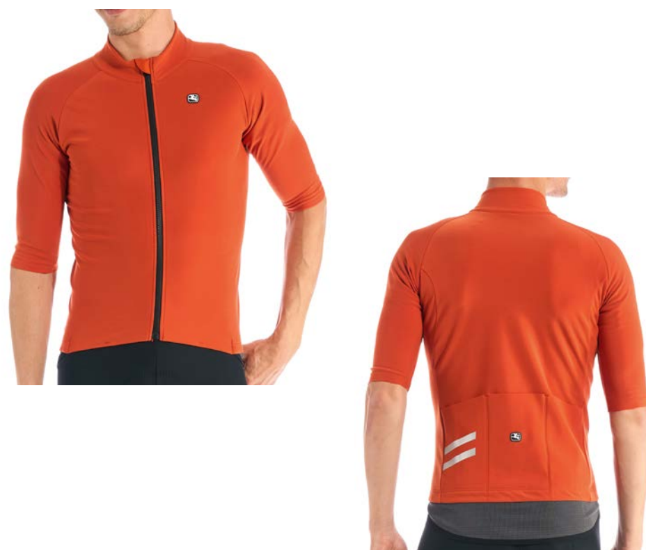
AV G-Shield Kurzarmtricot GICW21-SSJY-GSHI-ORAN sienna-orange / S-L / CHF 229.00