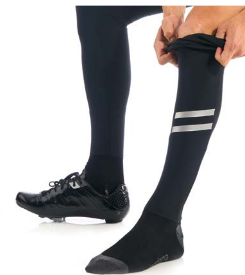
AV G-Shield Bein角度 GICW21-LEGW-GSHI-BLCK schwarz / XS- XL / CHF 99.00