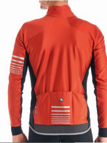
AV VERSA Men Winterjacke GICW21-JCKT-VERS-ORAN sienna-orange / M-XXL / CHF 499.00