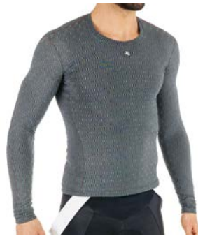
CERAMIC Langarm-Thermoshirt Men GICW16-LSBL-CERA-GREY grau / S-XXL / CHF 99.00