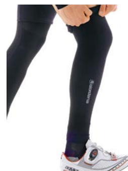
Beinstulpen Dryarn seamless GI-W1-LEGW-BCLW-BLCK schwarz / XS/S / M/L / CHF 69.00