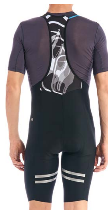
AV G-Shield Trägerhose kurz GICW21-BIBS-GSHI-BLCK schwarz / S-XXL / CHF 229.00