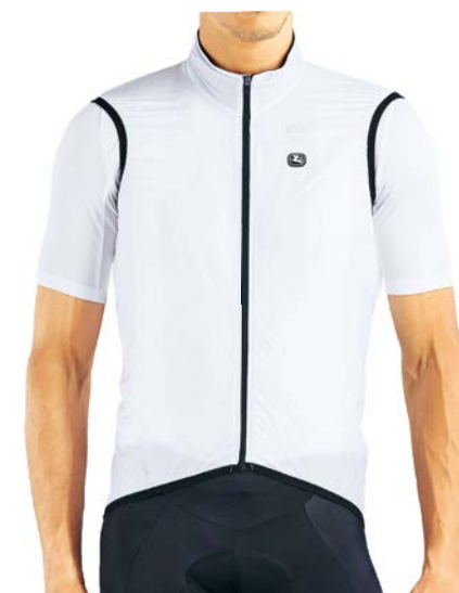
Zephyr Windgilet GICS19-VEST-ZEPH-WHIT weiss / S-2XL / CHF 139.00