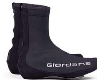
AV 300 Schuhüberzug GICW21-SHCO-A300-BLCK schwarz / M-XXL / CHF 159.00