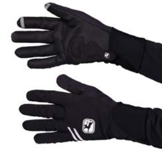
AV 200 Handschuhe GICW21-WNGL-A200-BKGY schwarz-grau / S-XXL / CHF 119.00