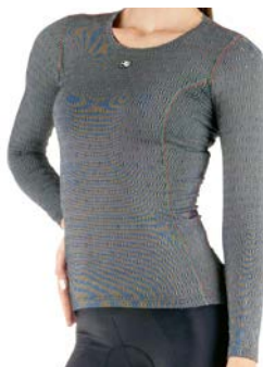
CERAMIC Langarm-Thermoshirt Women GICW16-WLSB-CERA-GREY grau / XS-XL / CHF 99.00