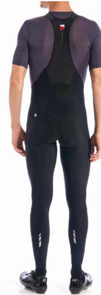
FRC PRO Thermo Trägerhose GICW21-BITI-FRCP-BLCK schwarz / S-XXL / CHF 289.00